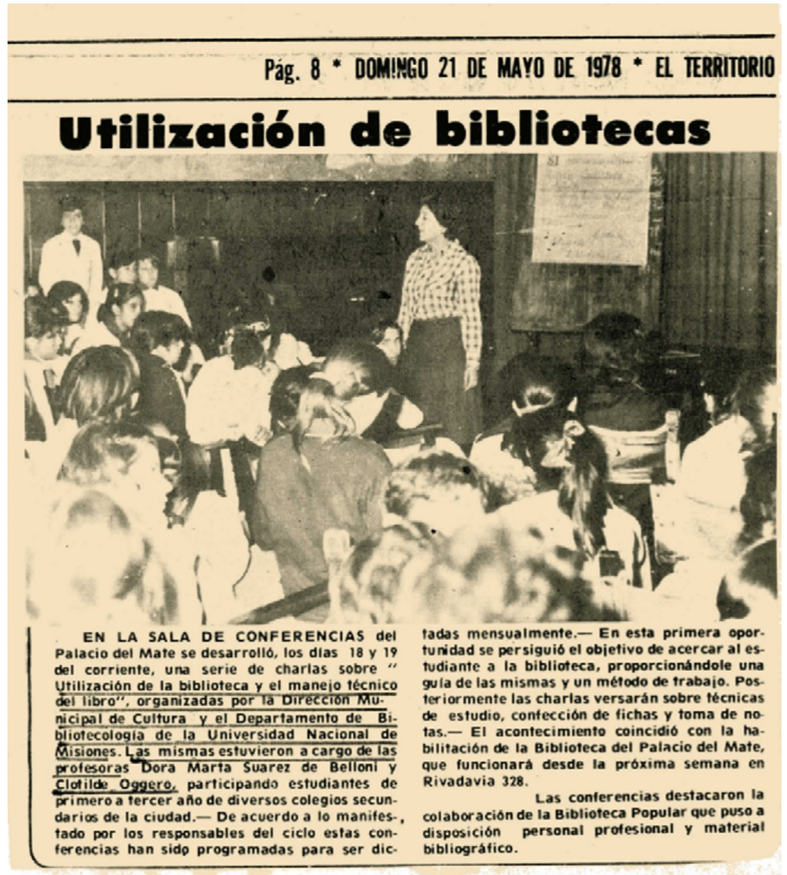
Nota Nº 1. El Territorio, 21 de mayo de 1978: 8

participó con charlas en torno al “Aprovechamiento integral de bibliotecas escolares” (El Territorio, 10 de mayo de 1978).